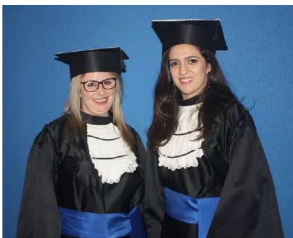
Formatura dos Cursos Técnicos em Administração, Serviços Públicos e Meio Ambiente (p. 3)