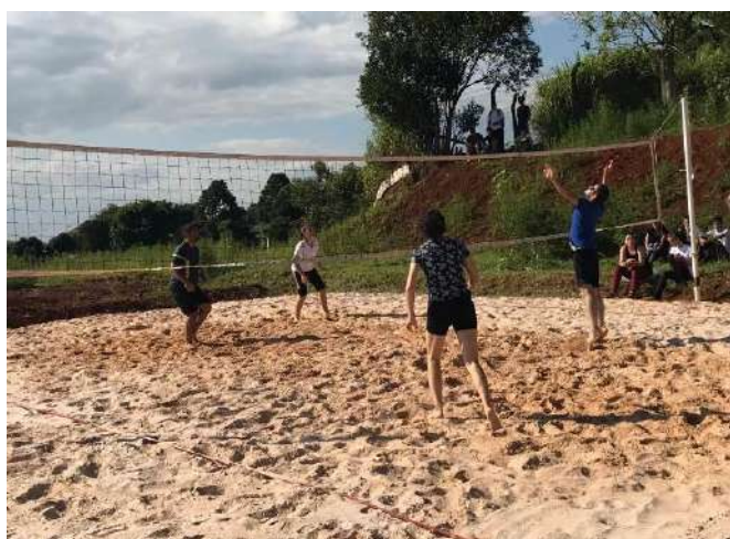
Semana de integração marca início das aulas (p. 7)