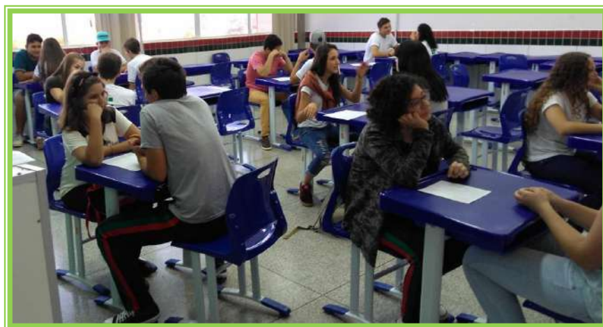
Dinâmica grupo de pesquisa