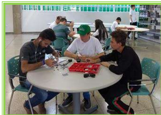
Robótica semana de integração