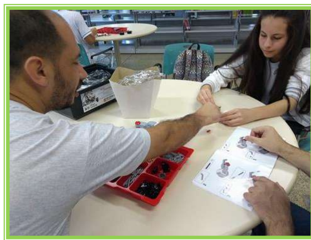
Robótica semana de integração