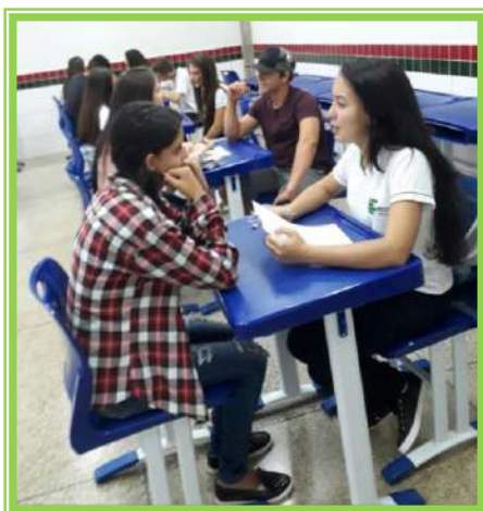
Dinâmica grupo de pesquisa