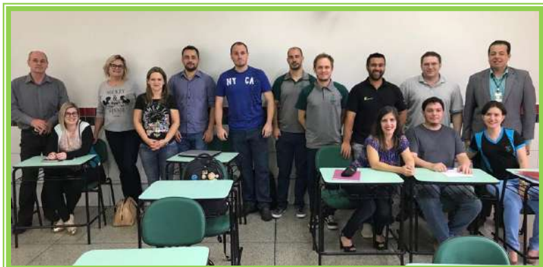
Participantes da formação pedagógica