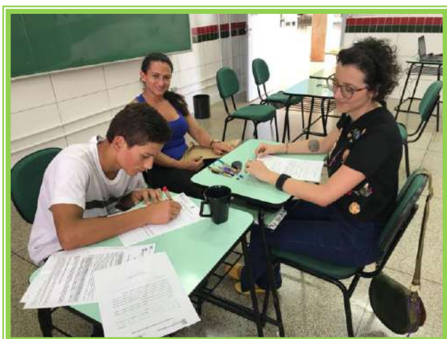
Matrículas do processo seletivo